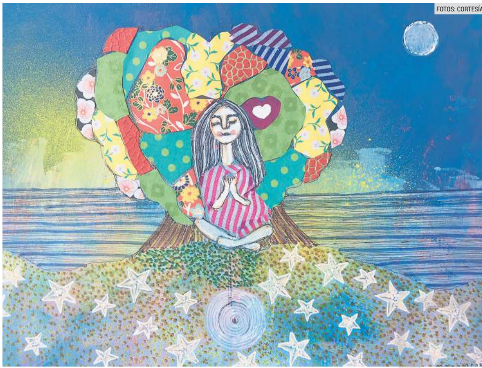
MATERIAL REUTILIZADO. Moná aprovechó aquellos objetos que le servían para expresarse a través del arte.

En cuanto a la técnica, Orozco agregó que las piezas e instalaciones recurren a lo mixto: "Empiezo a dibujar, luego recorto, pinto, luego pego, hay algunas que están elevadas, las reinstalo con palitos de madera reciclables, las hago tridimensionales, pueden dar la vuelta. No son estáticas".