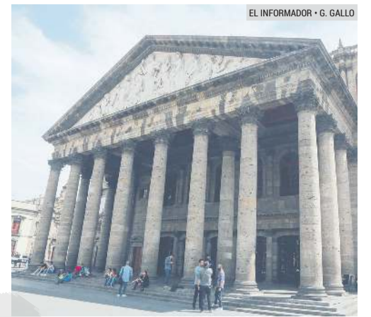
TEATRO DEGOLLADO. Recinto donde la Orquesta Filarmónica de Jalisco ofrecerá el tercer concierto de su última temporada de 2021.